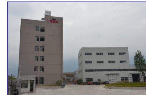
Alojamientos de Operarios.