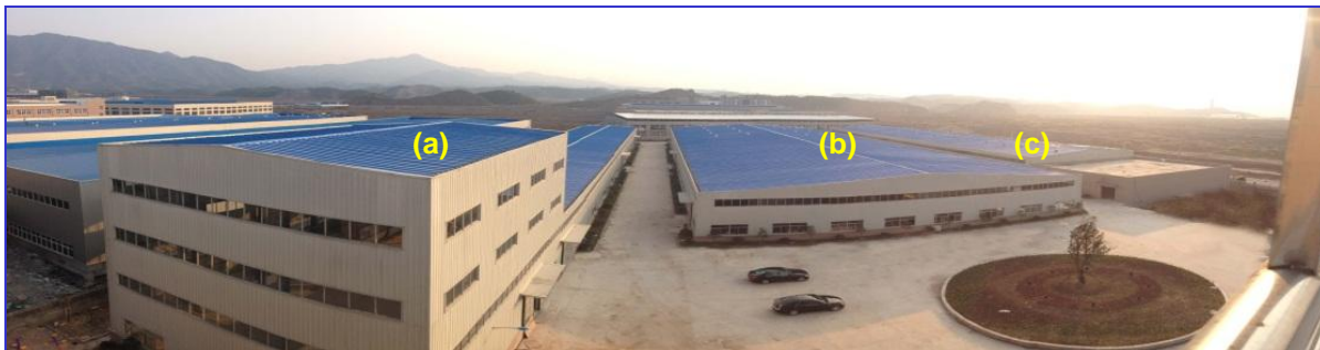
Centros de Producción - Laboratorios - Almacenaje - Embalaje y Expedición (a,b,c) .