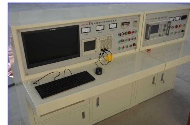
Panel de Control Computerizado y Equipos de Medida.