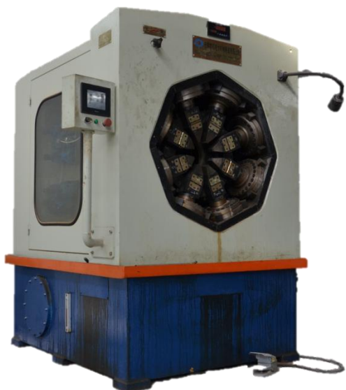
Nuevos Bancos de Compresión Radial.