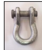
Grillete Recto Ref. GN