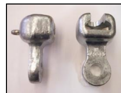
Rótula Corta R – Rótula Larga R**P