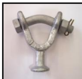
Horquilla-Bola Ref. HB