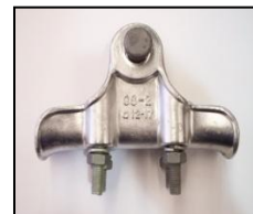
Grapa de Suspensión Ref. GS