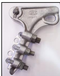
Grapa de Amarre Ref. GA